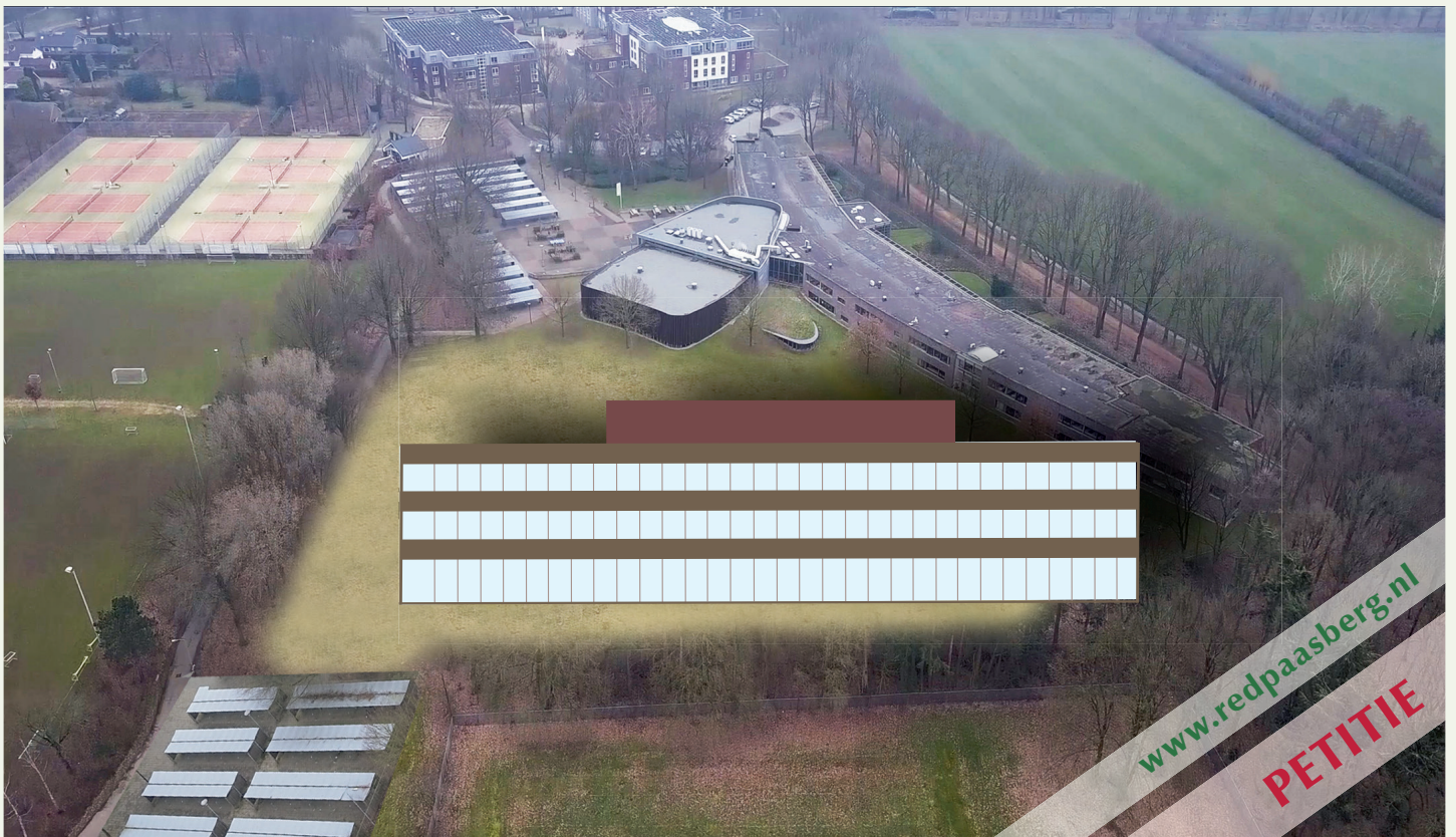
Het moderne glazen gebouw steekt ver boven het Isala College uit.